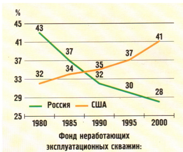
Рисунок 2. Динамика изменения КИН в России и США

С другой стороны, массовое применение таких технологий, как гидроразрыв пласта, бурение горизонтальных скважин, глубоко проникающая перфорация, наряду с безусловной пользой их применения в оптимальных геолого-технических условиях, для которых они разработаны, имеют и отрицательные моменты. В целом по России упал коэффициент извлечения нефти, вырос фонд простаивающих скважин (рис. 2).