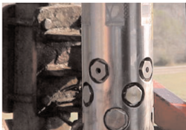
Рисунок 2а. Hydra-Jet™ – специальная гидромониторная насадка для проведения операции SurgiFrac [5]

Из-за увеличения давления, создаваемого в размывной полости постоянной закачкой через гидромониторную насадку, общее давление в полости всегда на несколько сотен Па выше, чем давление в стволе скважины (затрубное пространство); поэтому давление внутри ранее созданных трещин никогда не достигает величины, при которой они бы открывались повторно и снова увеличивались, и, таким образом, механическая изоляция интервала разрыва не требуется.