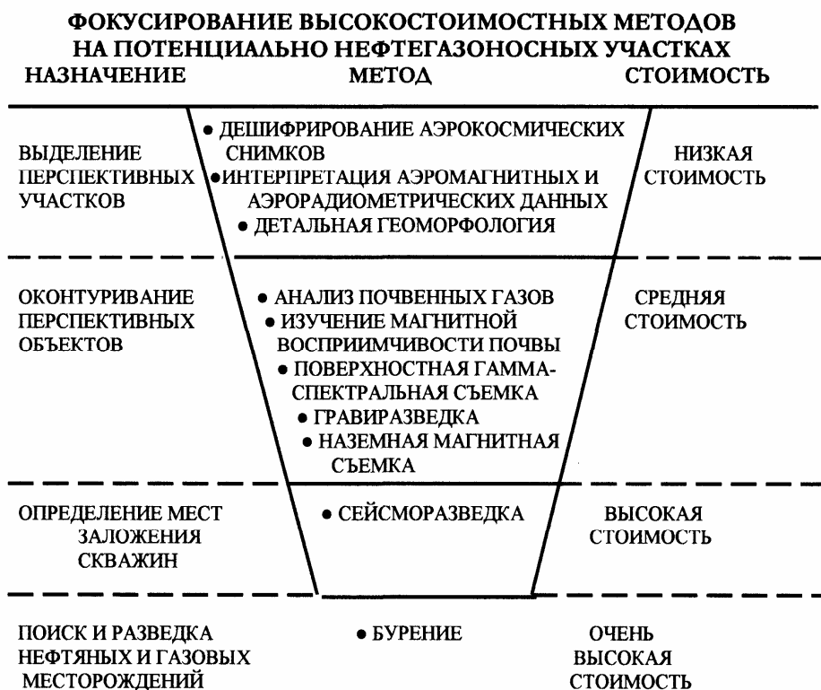
Рисунок 1. Интегрированная система поисково-разведочных работ на нефть и газ в ловушках неструктурного типа

(сложнопостроенные коллекторы) – частотные графики распределения Q_{\text{нач}} и Q_{\text{нак}} резко ассиметричны.