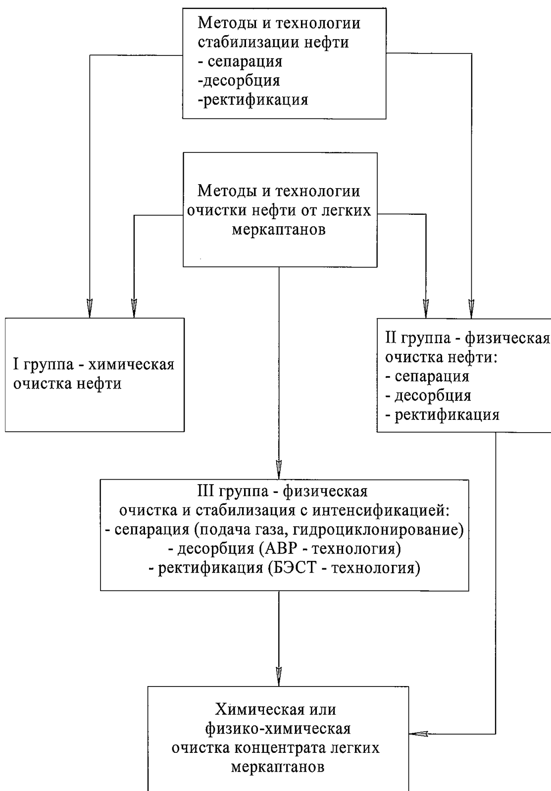
Рисунок 2. Классификация методов и технологий очистки и стабилизации меркаптансодержащей нефти