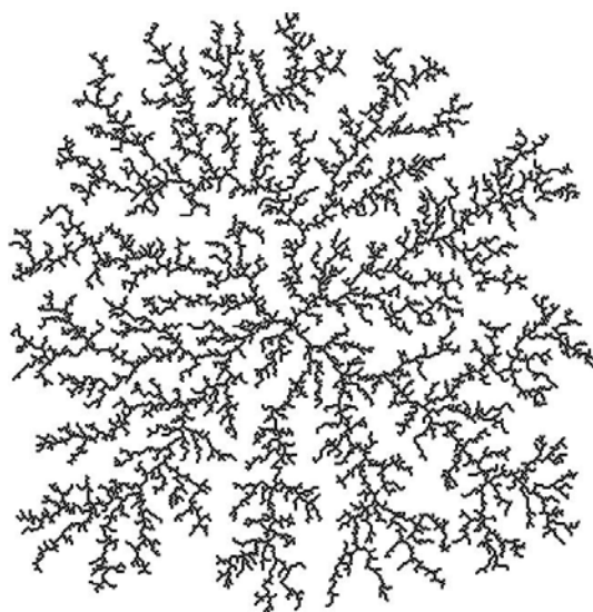
Рисунок 3. Кластер в модели ДОА

Для воспроизведения дендритного роста мы использовали модель ДОА с одной затравочной частицей в центре квадратной решетки. При этом присоединение частицы может быть слабым — одна-единственная связь с кластером, средним — 2 связи, сильным — 3 связи. Число связей мы определим как число вершин частицы, соприкасающиеся с кластером. Легко доказать, что в этой модели число связей не может превышать 3.