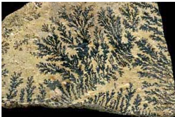
Рисунок 1. Псилометан

Цвет: черный, буро-черный. Блеск: металлический, матовый, смолистый. Прозрачность: непрозрачный. Черта: черная, бурая. Твердость: 4—6, хрупкий. Плотность: 4,4—4,7. Излом: неровный, шероховатый. Сингония: моноклинная. Форма кристаллических выделений: тонкокристаллические агрегаты, гроздьевидные, желвакообразные, рыхлые землистые массы; псиломелан встречается также в виде скелетных кристаллов — дендритов на поверхностях скола пород. Класс симметрии: призматический — 2/m . Отношение осей: 3,319 : 1 : 4,809 ; b = 92^\circ 30' . Спайность: Отсутствует. П. тр.: Не плавится. Поведение в кислотах: растворяется в HCl.