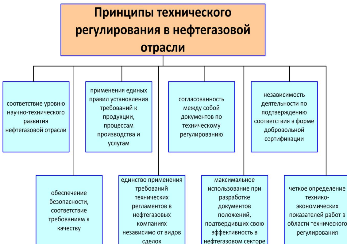
Рис. 2. Принципы технического регулирования