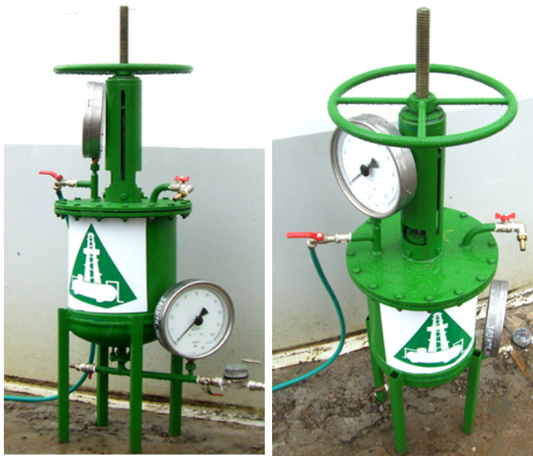
Рис. 1. Экспериментальный адсорбер

В качестве сорбента для условий Павловского месторождения (табл. 1) был выбран синтетический материал «Мегасорб» волокнистой структуры (табл. 2).