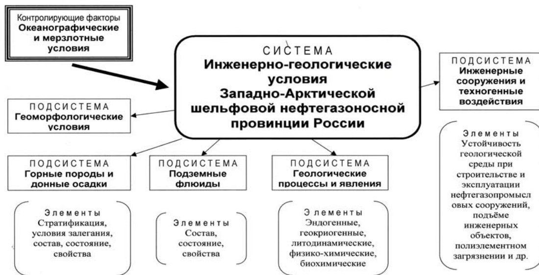
Рис. 1 Инженерно-геологические условия Западно-Арктической шельфовой нефтегазоносной провинции России (система знаний)

Баренцеву морю, свойственна существенная расчленённость. Рельеф шельфа представлен сложным чередованием структурных, структурно-скульптурных и скульптурных форм различного генезиса и возраста, является одним из важнейших компонентов инженерно-геологических условий.