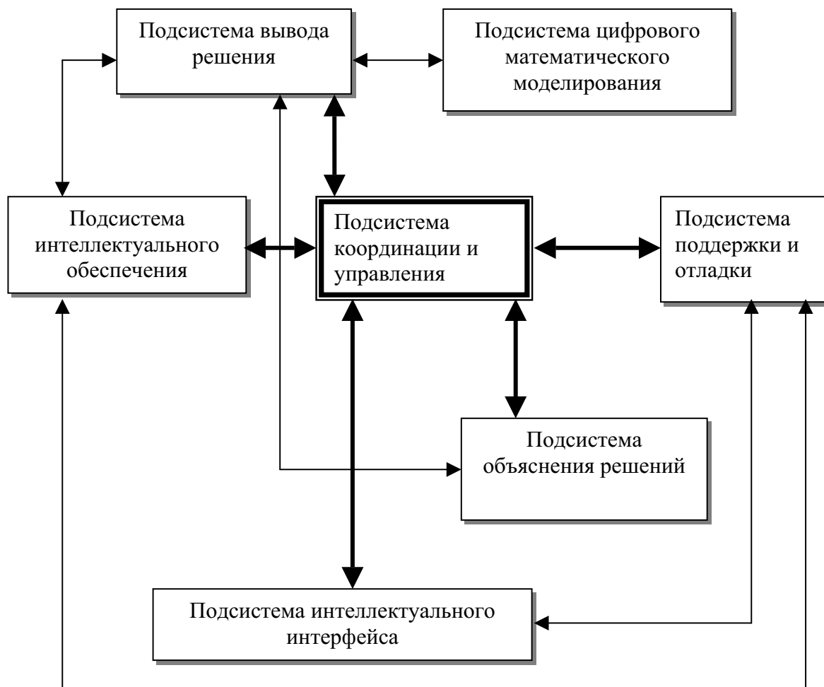
Рис.1. Архитектура ЭС ГВ

Подсистема интеллектуального интерфейса является совокупностью программно-аппаратных средств, которые обеспечивают дружественное интеллектуальное общение непрограммирующих пользователей (лиц, принимающих решения) с ЭС ГВ на ограниченном естественном языке при накоплении знаний, поиске и объяснении управленческих решений для снижения газовых выбросов.