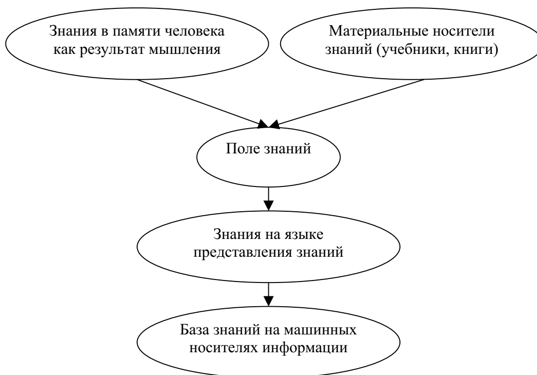
Рис. 2. Этапы трансформации знаний при создании ЭС ГВ

Для поиска решений задач ЭС ГВ с помощью процедурных знаний требуется многообразная фактографическая информация в виде некоторых структурированных данных (машинные слова, вектора, массивы, файлы, списки, абстрактные типы данных). На рис. 2 показаны этапы трансформации знаний при создании ЭС ГВ.