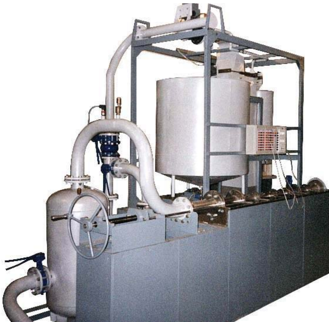
Рис. 1. Объемно-массовая установка

Рассмотрим устройство объемно-массовой установки на примере сервисной проливной установки, разработанной и производимой ОКБ “Гидродинамика” (рис.1). Сервисная установка, исходя из своего назначения, должна обеспечивать поверку и настройку большого числа приборов различных типов, различных типоразмеров, имеющих различные выходные сигналы, и максимально обеспечивать потребности регионального сервисного (внедренческого) предприятия.