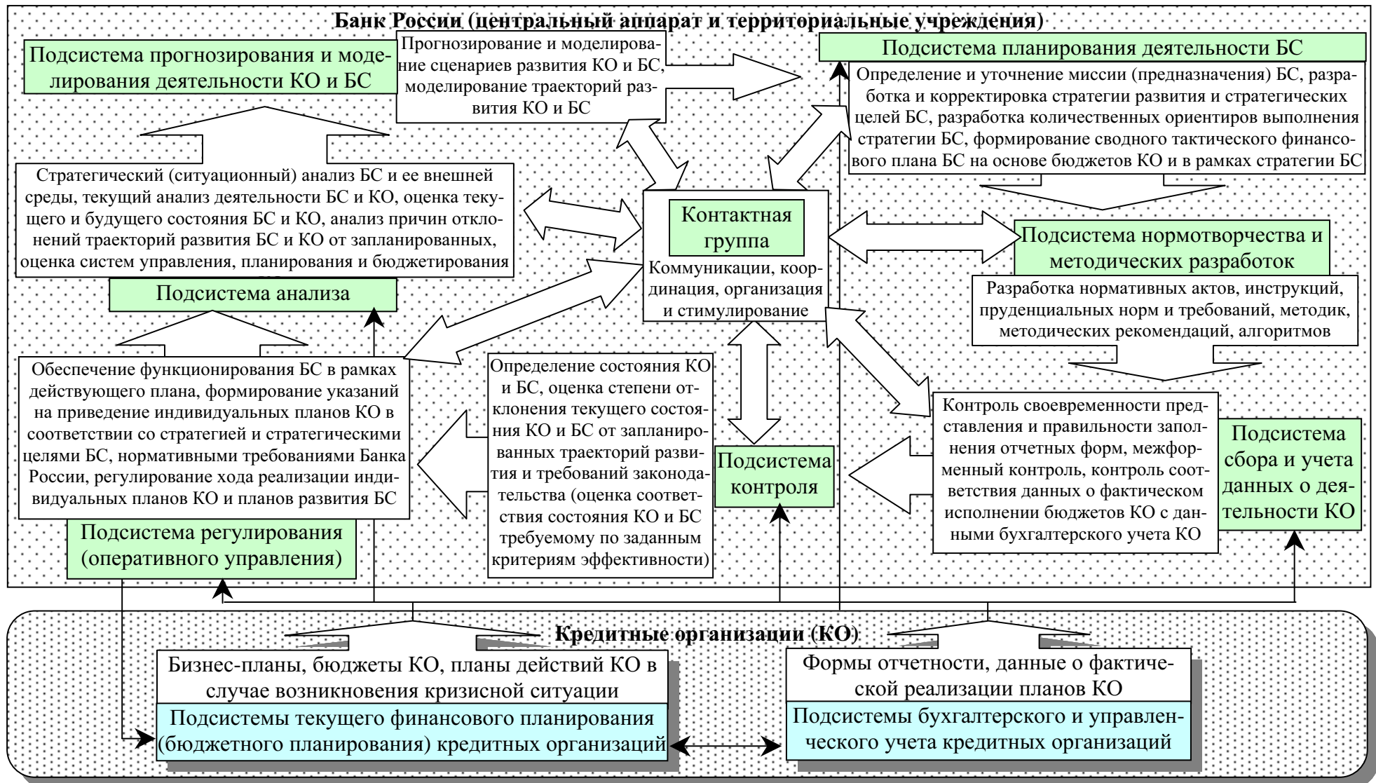
Рисунок 3 - Система бюджетирования деятельности банковской системы (БС)