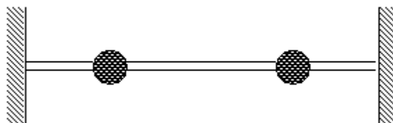
Рисунок 1. Общая схема резонатора

Схема исследуемого резонатора показана на рис.1. Учитывая симметричность колебаний трубки относительно ее середины расчетная схема резонатора может быть представлена как на рис. 2. Разделим условно половину трубки на два участка: первый – от места заделки до инерционной массы, второй – от инерционной массы до середины трубки.