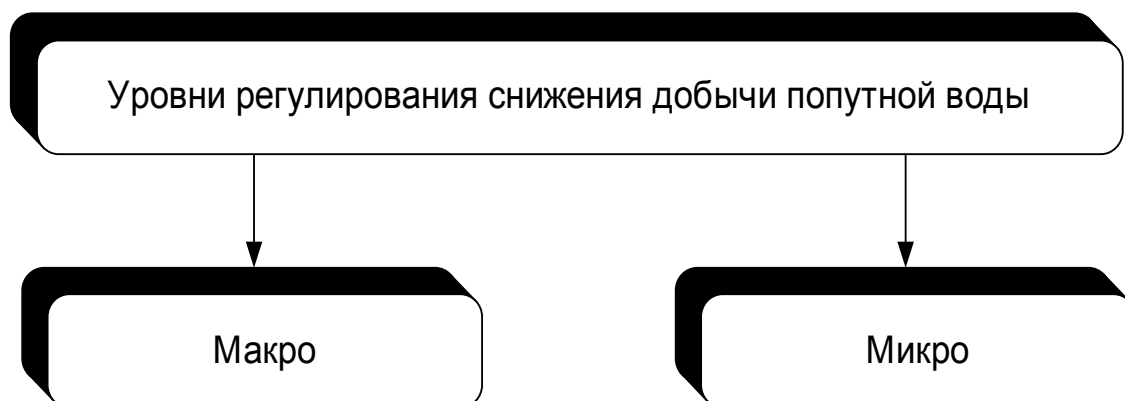
Рис. 1. Уровни регулирования снижения добычи воды

Первостепенной задачей, стоящей перед основными нефтедобывающими компаниями, становится выработка общей концепции снижения добычи флюида с высоким содержанием воды. Постараемся вывести теорию глобального рассмотрения проблемы снижения извлечения воды. В первом приближении разделим вопрос на макро и микроуровни (см. рис. 1).