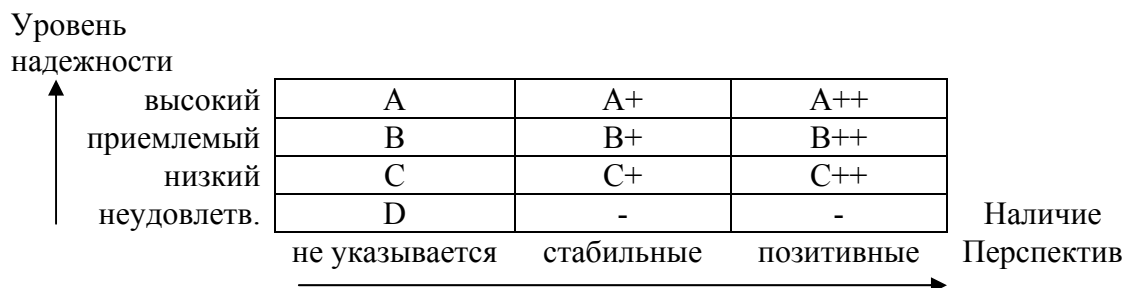
Рисунок 4. Матрица для определения класса надежности страховой компании