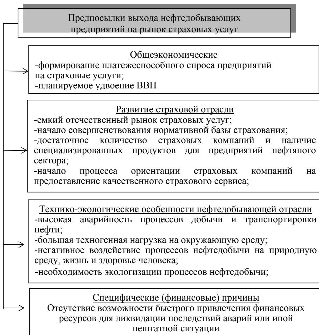
Рисунок 1. Предпосылки выхода НГДП на рынок страховых услуг

Показатели оценки эффективности страховых операций в отечественной теории и практике страхования достаточно давно изучаются и применяются специалистами-страховщиками. Однако договор страхования – это двухсторонняя сделка, в которой обязательно участвуют, как минимум, две стороны – страховщик и страхователь. И если с позиции страховщика вопрос достаточно хорошо изучен, то методические основы определения эффективности страхования с точки зрения предприятия освещены не в полной мере, что определяет актуальность исследования обозначенной проблемы.